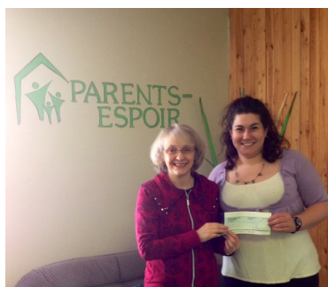
PHOTO de MAMAN

Des copies ont commencé à être distribuées dans différents départements à l'Institut Universitaire en Santé Mentale et en septembre 2014, d'autres seront distribuées dans les cliniques de soins.